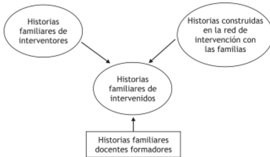
Figura 1. Red de historias en el encuentro interventivo